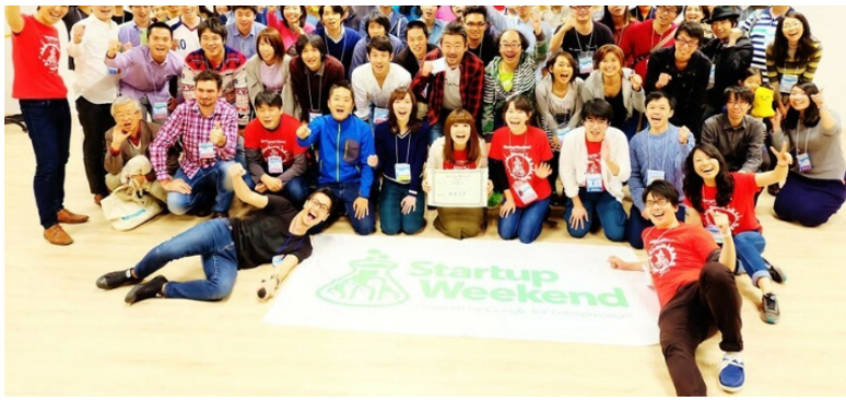
※StartupWeekend 開催時の集合写真