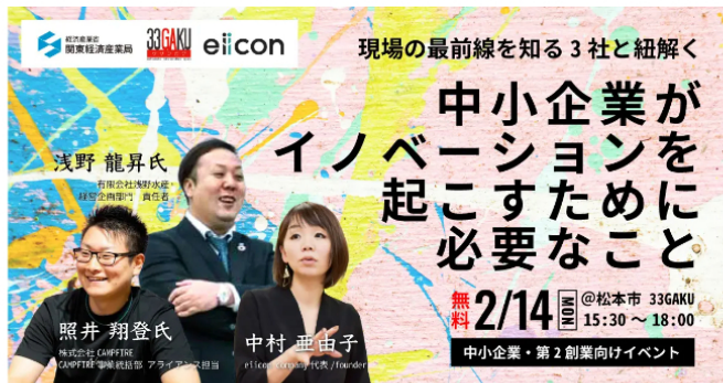
経済産業省 関東経済産業局 × 松本市×eiicon company 「中小企業がイノベーションを起こすために必要なこと」

日本最大級のオープンイノベーションプラットフォームAUBA（アウバ：以下「AUBA」）を運営するeiicon companyは、関東経済産業局、松本市とともに、企画・設計・運用からPR戦略まで、本イベントの運営全般を強力にサポートしてまいります。